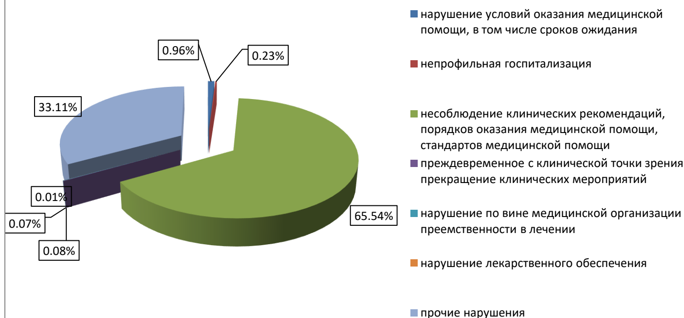
Дефекты, выявленные при проведении экспертизы качества медицинской помощи