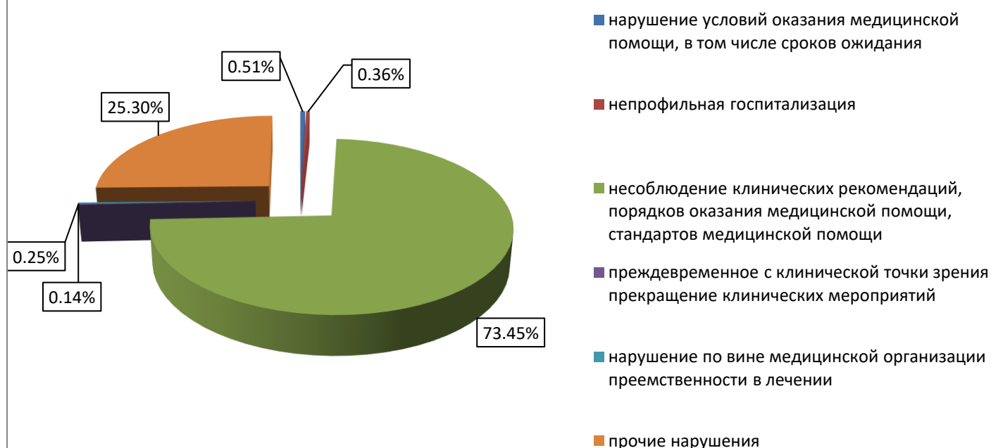
Дефекты, выявленные при проведении экспертизы качества медицинской помощи