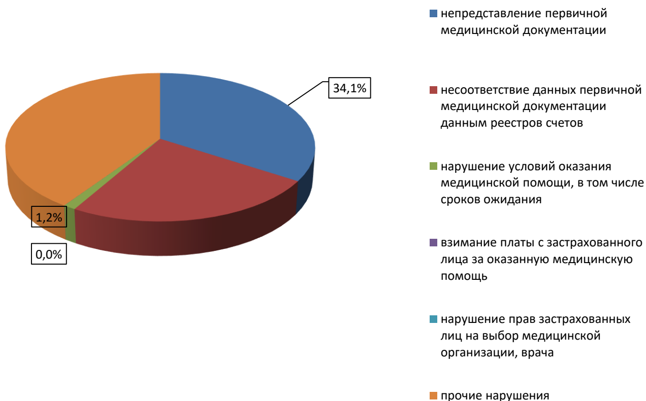
Дефекты, выявленные при проведении медико-экономической экспертизы